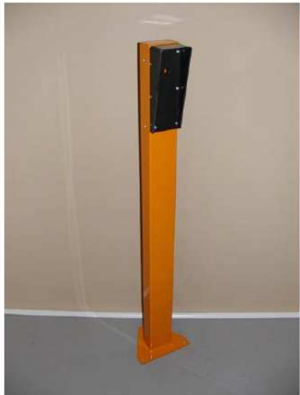
sloupek se stříškou