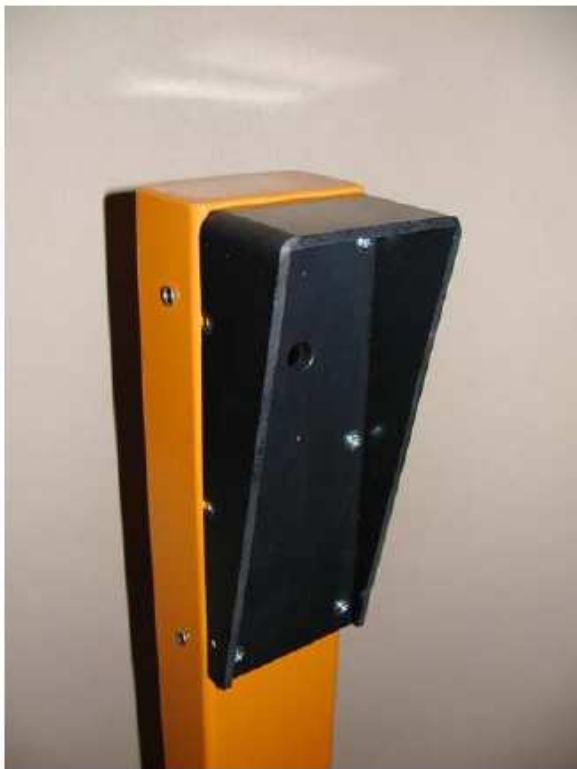
detail stříšky na sloupku