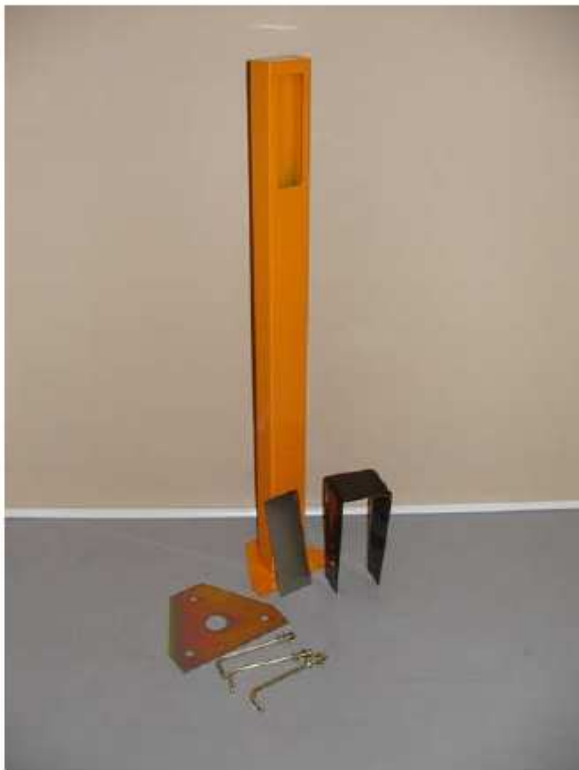
sloupek, základna, nerezová deska a stříška