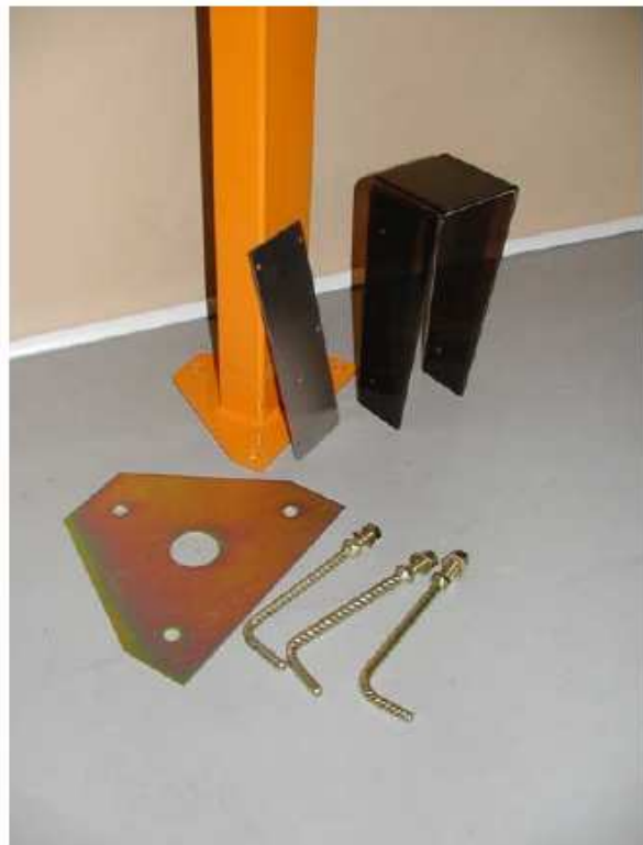
detail základny, nerezové desky a stříšky